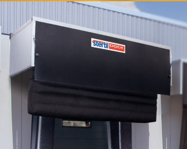
Opblaasbaar bovenste kussen voor kleinere bestelwagens

U kunt contact met ons opnemen voor meer informatie over de Stertil Van Hybrid Dock Shelters of andere hoogwaardige Dock Producten van Stertil.