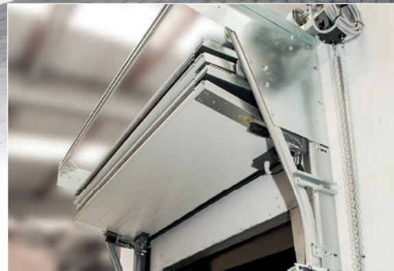
Slim ontworpen vouwdeur

De WSTP Van Hybrid Dock Shelter is meer dan alleen een shelter: het is een compleet systeem. De slim ontworpen vierkante vouwdeur bespaart ruimte door handig op te vouwen boven het shelter, om optimaal gebruik te kunnen maken van de beschikbare magazijnruimte.