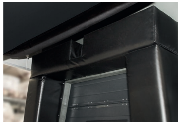
Speciale uitsparing voor camera's