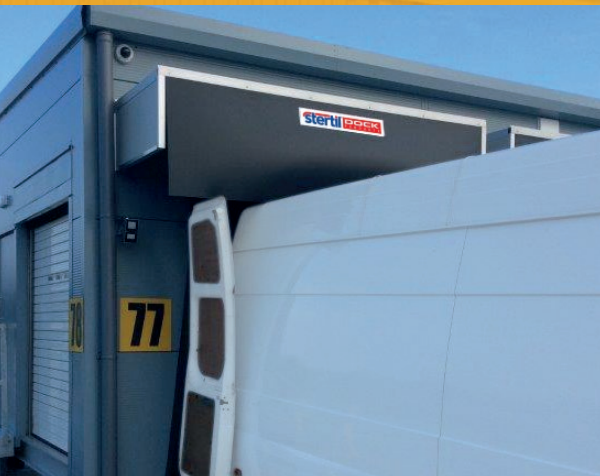
Speciaal WSTP-afdak tegen wind en regen